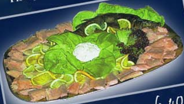
Familiensplatte für 6 Personen: Räucherkarpfenseite, Forellenfilets und geschnittene Lachsforellenfilets; wahlweise bis 80 €

Aus täglicher Räucherung werden die Fischplatten am selben Tag frisch zubereitet.