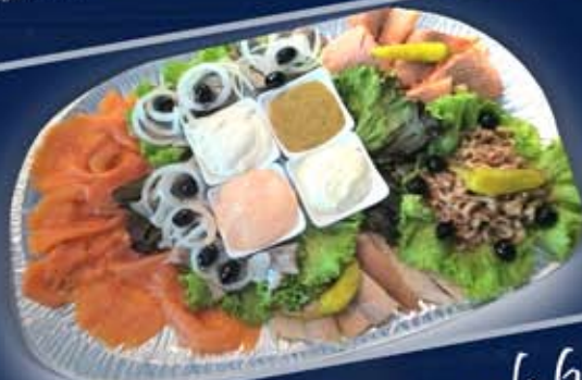
Matjesplatte für 5 Personen: mit Matjes, Nordseegarnelen, Premiumlachs, Forellenfilets, geschn. Lachsforellenfilets und einer kleinen Auswahl an Dips; wahlweise bis 120 €