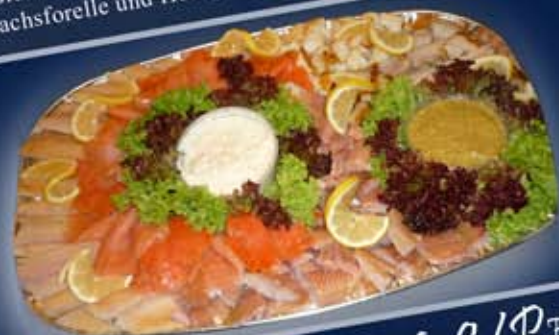
Primusplatte 3 ab 4 Personen mit zwei Sorten Lachs (Graved und Premium), Störfilet, Heilbutthappen, Butterfisch, Forelle, Lachsforelle und Honigsenfillsauce.