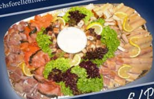
Primusplatte 2 ab 4 Personen mit Störfilet, zwei Sorten Lachs (Graved und Premium), Aalhappen, Forelle, Lachsforelle und Honigsenfillsauce.