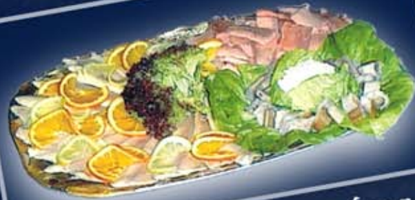
Aalplatte für 5 Personen: mit geschnittenem Aal, Forellenfilets und geschn. Lachsforellenfilets; wahlweise bis 100 €