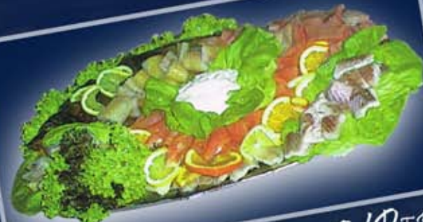
Primusplatte 1 ab 4 Personen: mit Lachsrollchen, Stör-, Butterfisch, Aalstückchen, Forellenfilets, geschn. Lachsforellenfilets.