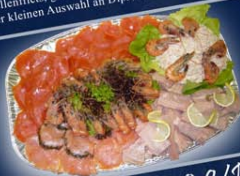
Deluxe Platte ab 4 Personen: Mit Wild-, Premium-, Gravedlachs, Shrimps in Cocktailsoße, gegrillten Gambas und Forellenfilethappen.